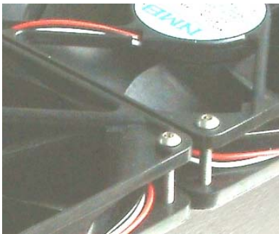
M4x35 Schrauben nur mit Lüfter verwenden!

Bei allen Radiatoren ist zu beachten, das die mitgelieferten Schrauben M4x35 nur für die Montage „mit Lüftern (Höhe 25mm)“ zu verwenden sind (siehe Abb.5). Sollten die Schrauben ohne Lüfter montiert werden, kann das zur Beschädigung des Radiators führen. Empfohlene Schraubengröße zur Montage ohne Lüfter: max. M4x8.